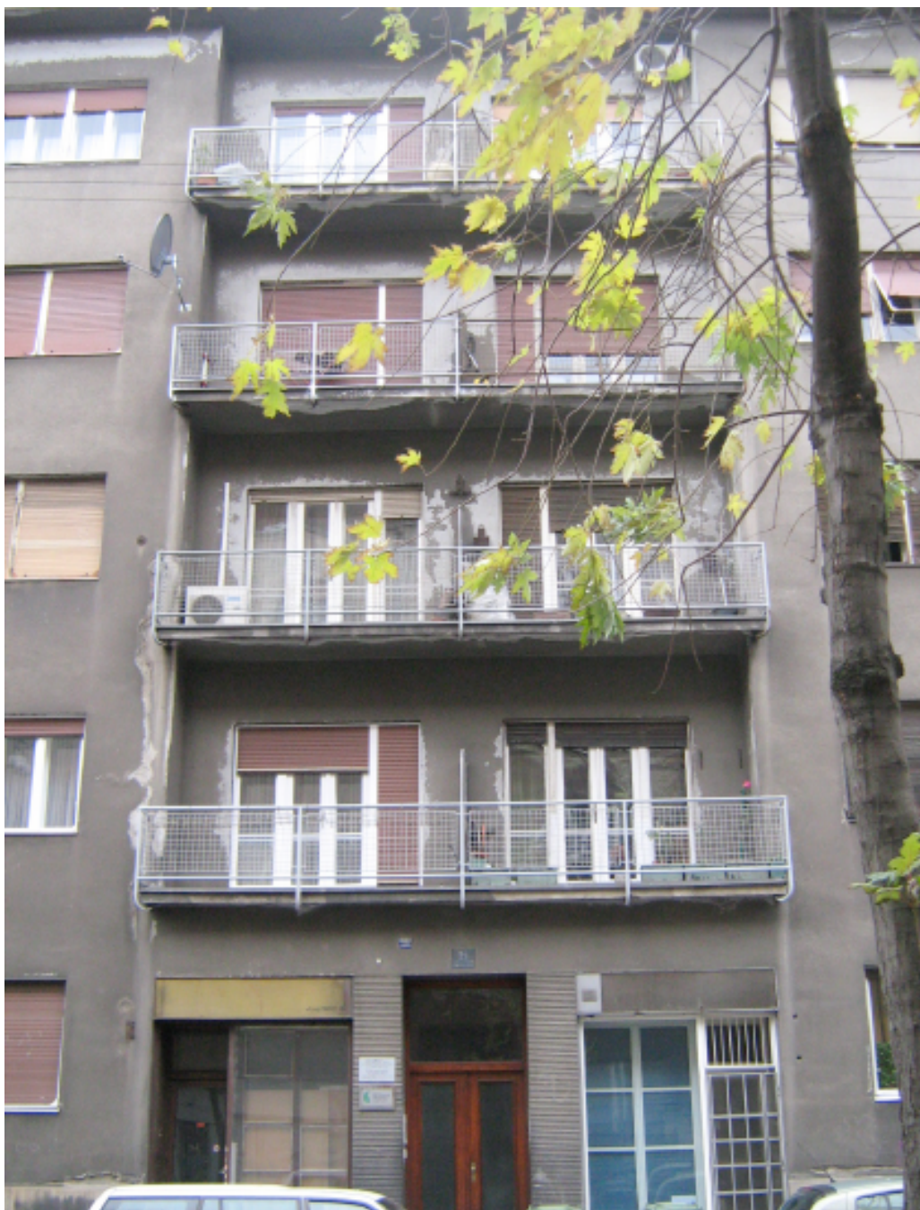
Prilog 4: Zgrada u Bauerovoj 24 u kojoj je stanovala obitelj Singer .