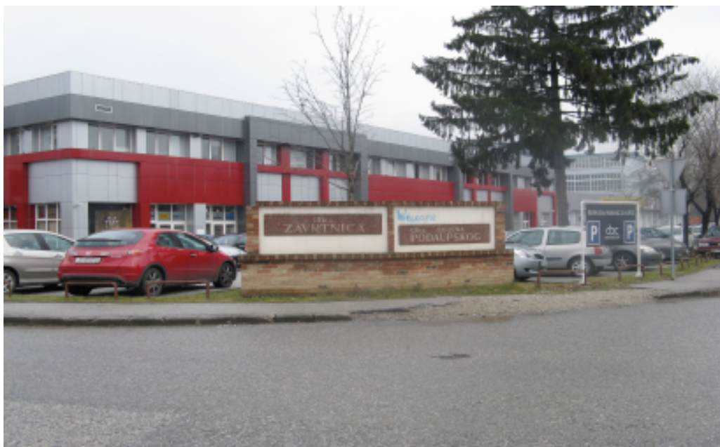
Prilog 2: Zavrtnica danas. Mjesto gdje se nekada nalazio sabirni logor.