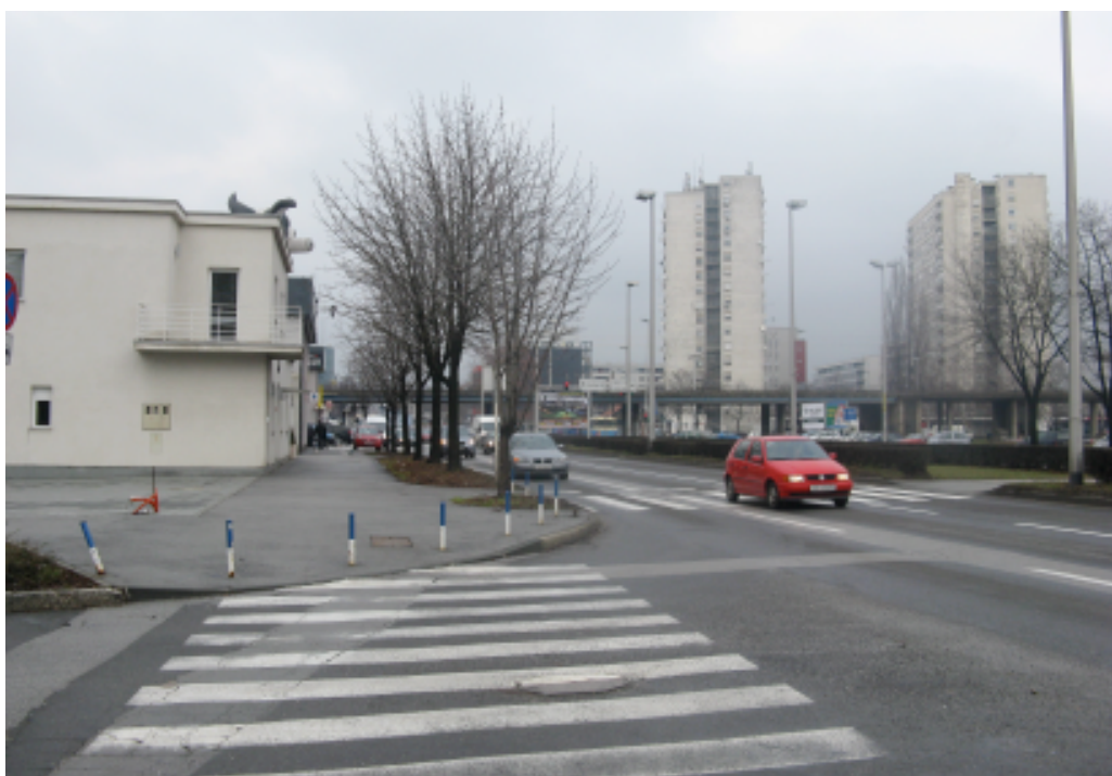
Prilog 3: Heinzelova ulica danas. Industrijskim kolosijekom bila je spojena sa sabirnim logorom.